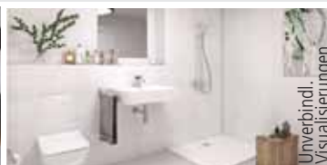
z.B. 3-Zi.-Whg., ca. 76 m 2 Wfl. 455.800 € zzgl. TG-Stellplatz