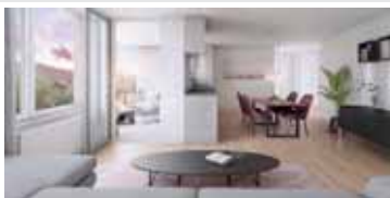
z.B. 2-Zi.-Whg., ca. 45 m 2 Wfl. 259.400 € zzgl. TG-Stellplatz