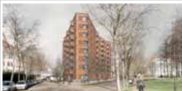
Einzigartige Architektur KfW-Effizienzhaus 55