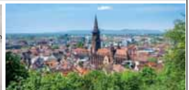
Zentrale Stadtlage nahe Institutsviertel