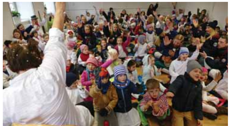
Jede Menge Narrensamen im Opfinger Rathaus